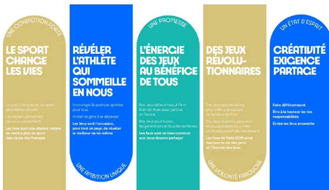
Vision des Jeux de Paris 2024

Paris 2024 souhaite que les Jeux soient un formidable laboratoire d'idées pour exprimer la capacité de ses partenaires et parties prenantes à répondre, à ses côtés, à d'importants enjeux de société. Cet événement planétaire débute dès maintenant, et il est primordial d'engager dès à présent tous ceux qui font et feront réussir notre pays.